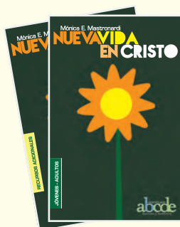
Nueva Vida en Cristo