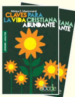
Claves para la Vida Cristiana Abundante